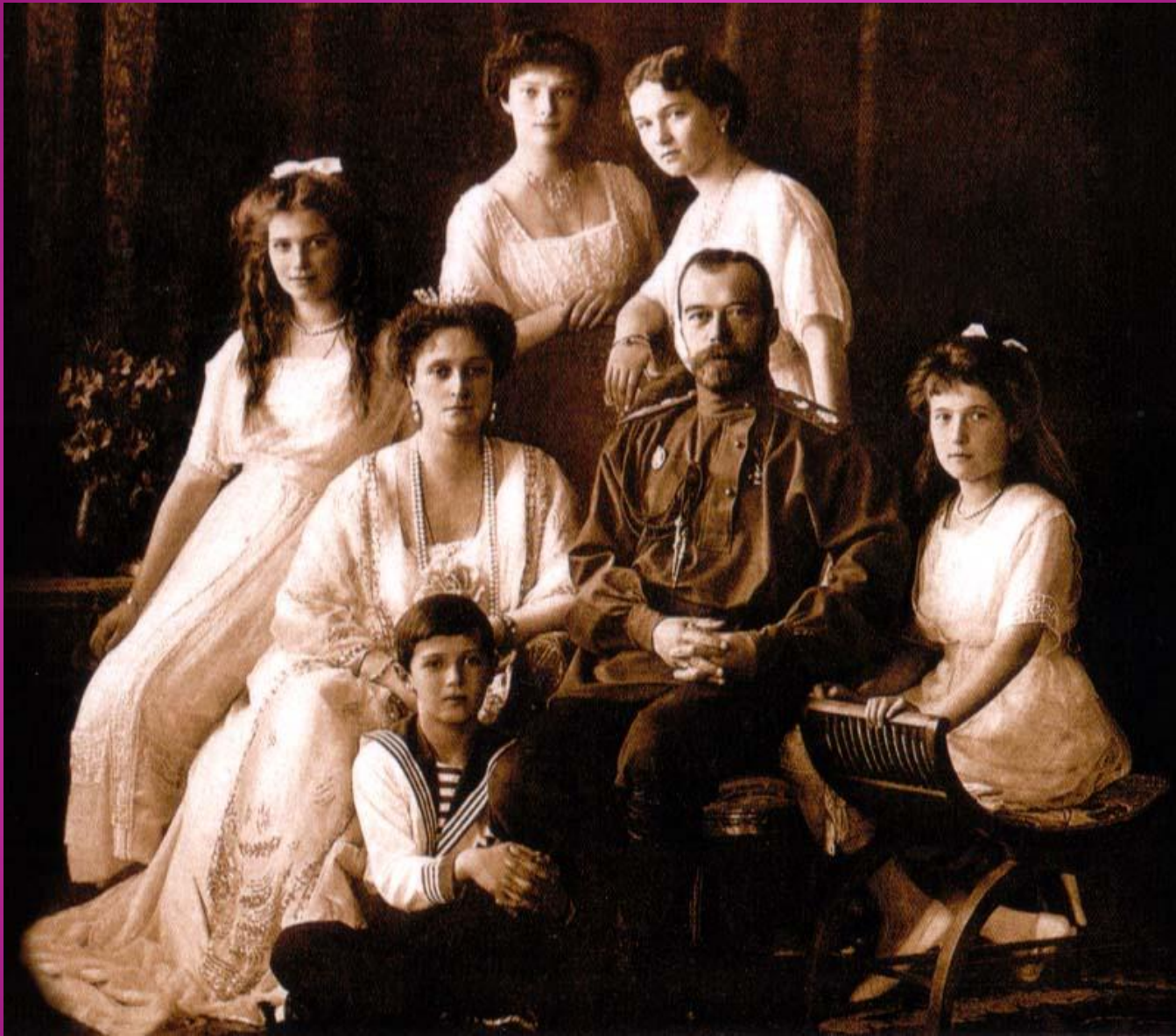
Семья императора Николая II