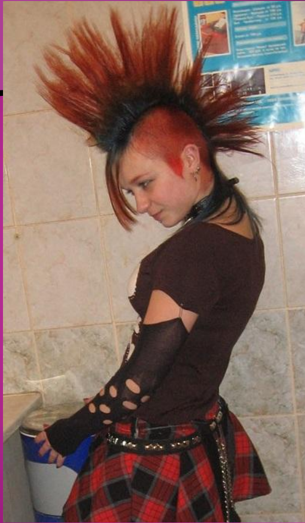
Девочка - панк

Является ли облик этих девочек женственным?