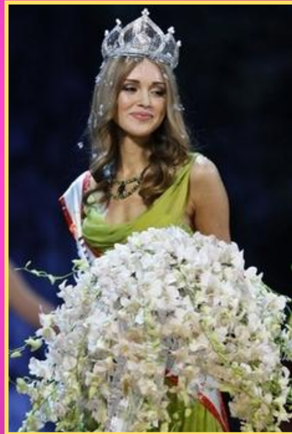
Мисс мира 2008 Ксения Сухинова